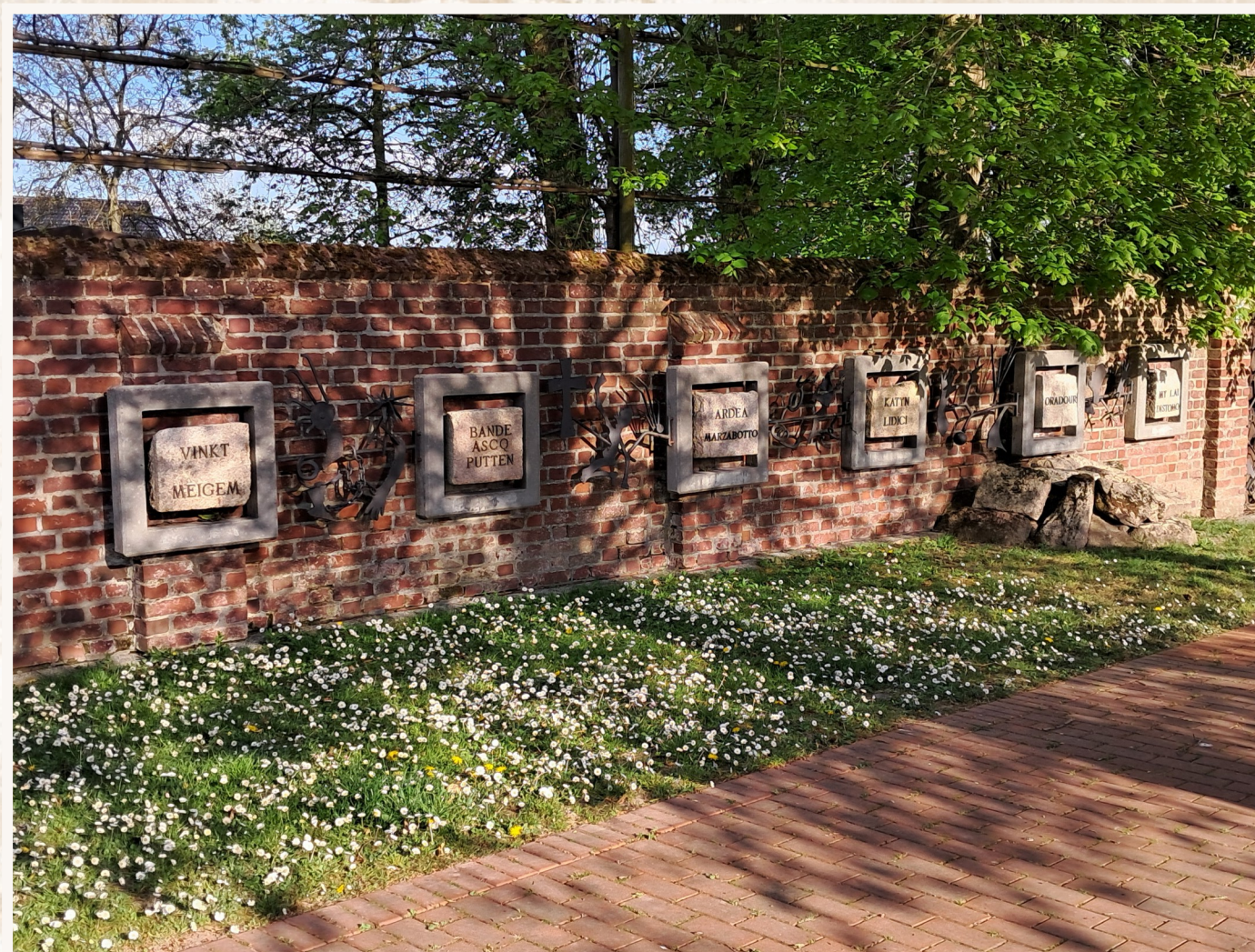
'De muur der getuigenissen' op het kerkhof van Vinkt met de namen van de dorpen waar onschuldige burgers het slachtoffer werden van oorlogsmisdaden.