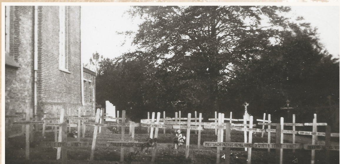
De eerste burgerbegravingen naast de kerk in Vinkt.