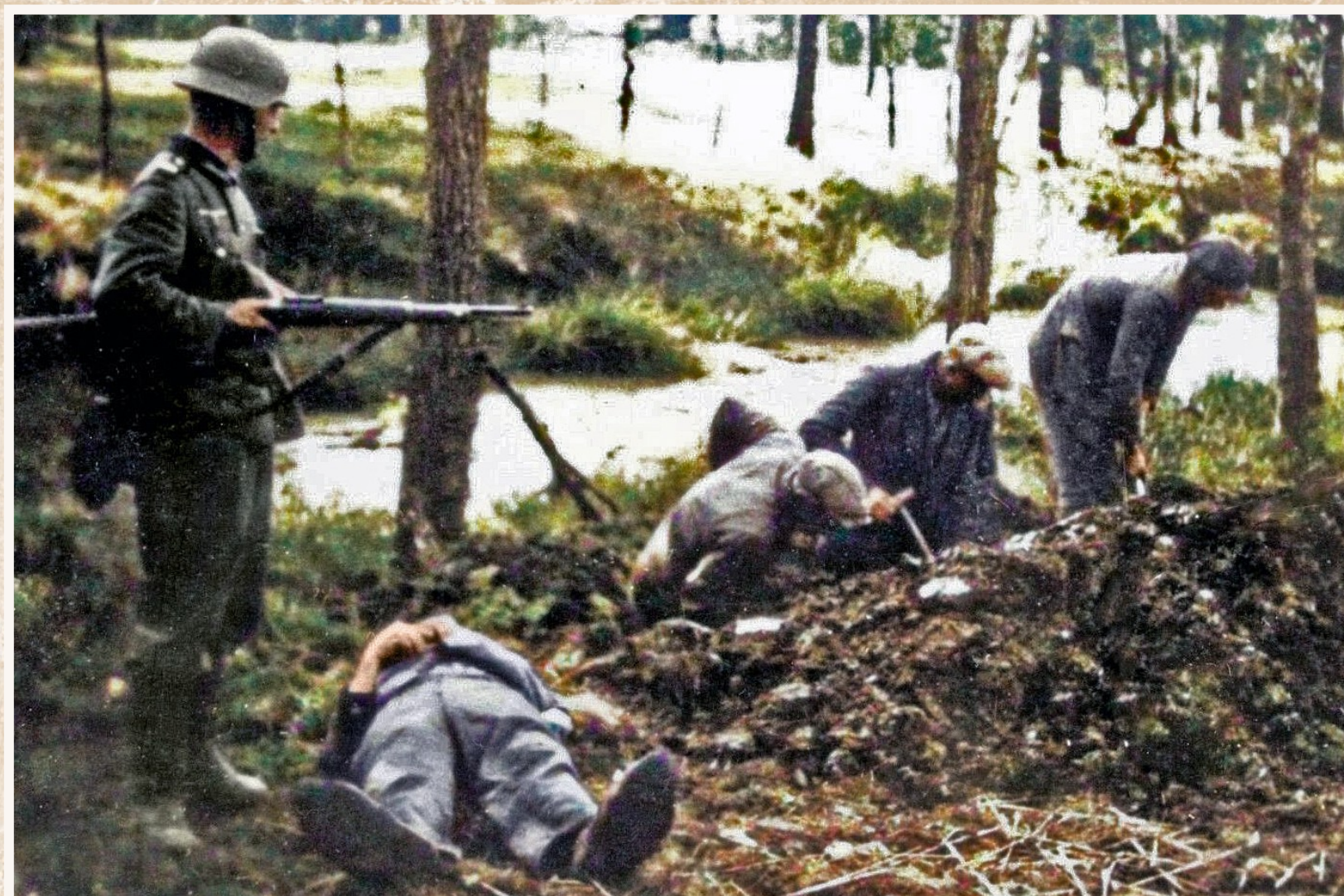
Onder zware bewaking moesten gevangen burgers op 27 mei de graven delven van de eerste drie geëxecuteerde burgers op de hoeve Van der Vennet, op 200 meter van Kruiswege.