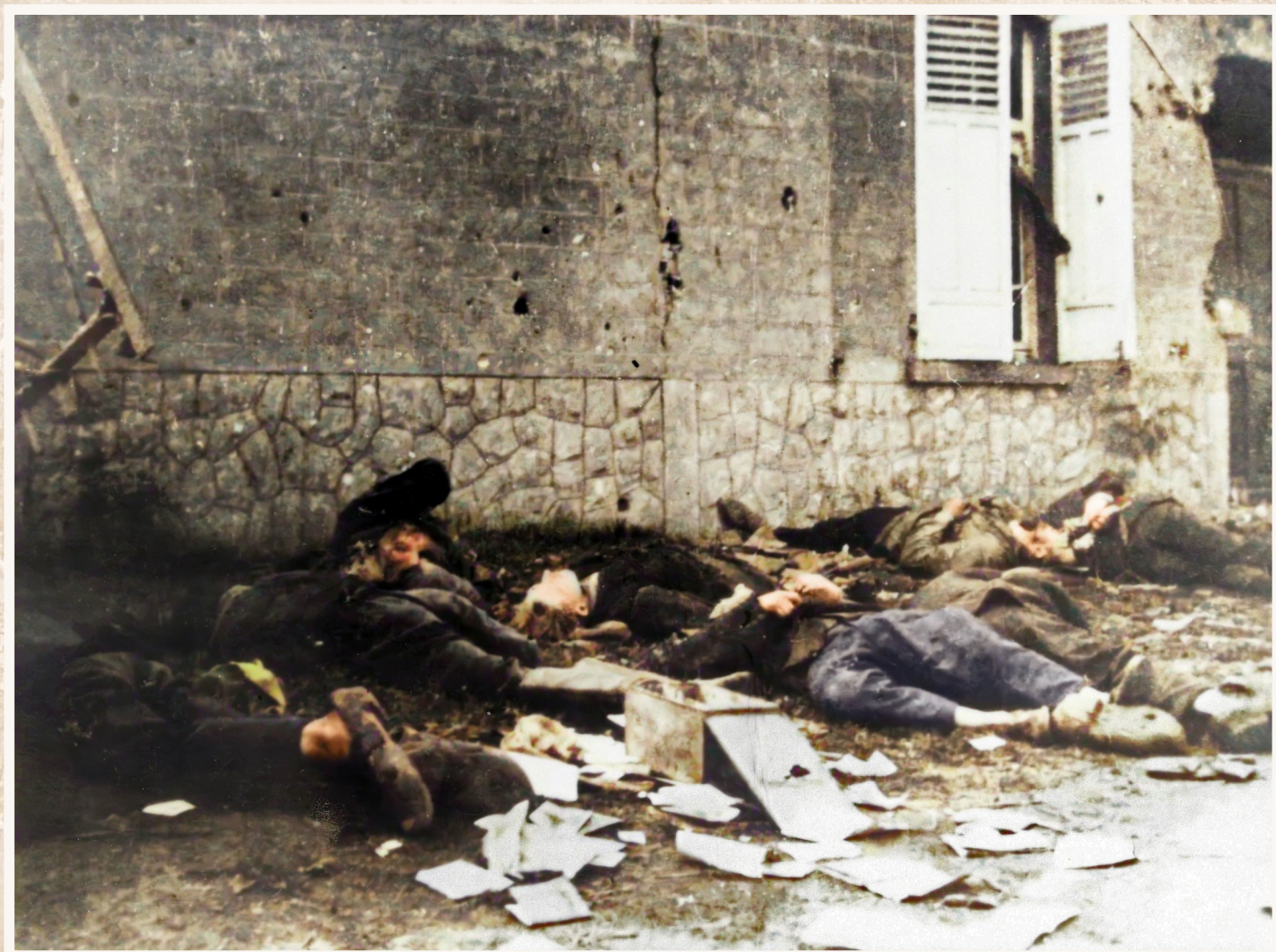
De op 27 mei vermoorde burgers aan het Zwart Huizeke in Meigem werden eerst in een massagraf begraven dat pas twee weken later werd ontdekt.

De meesten werden achteraf overgebracht naar de begraafplaats van hun dorp en werden er veelal op een ereperk begraven.