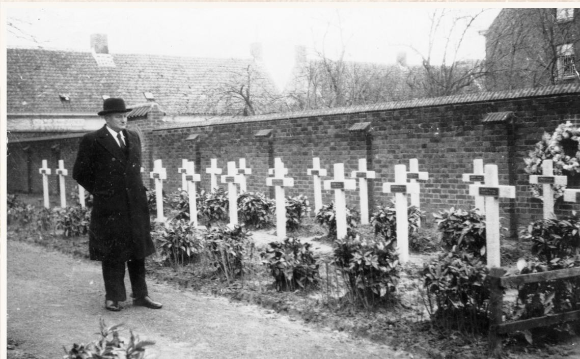
De eerste erebegravingen op het kerkhof in Vinkt.