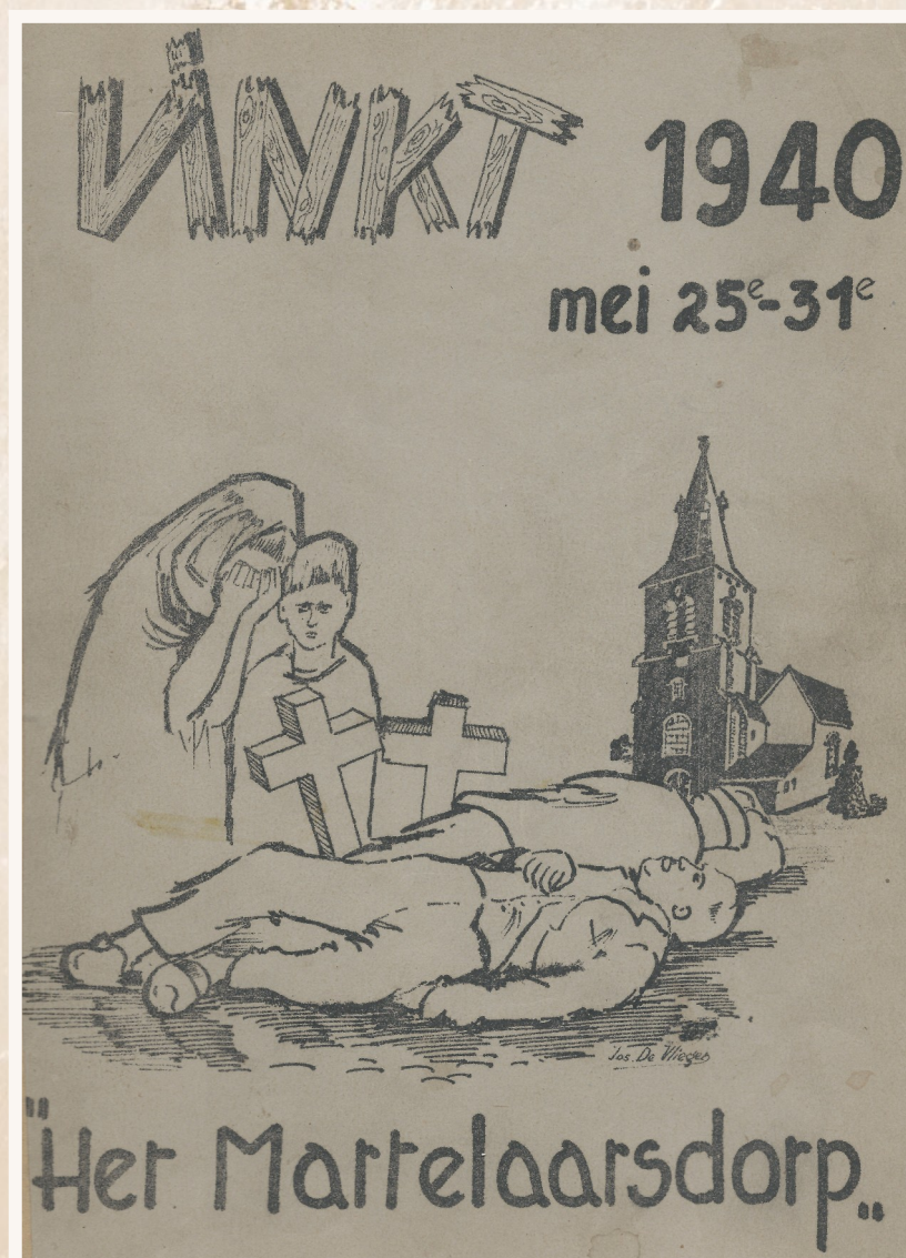
Het boek 'Vinkt 1940. Het martelaarsdorp' verscheen in 1967.