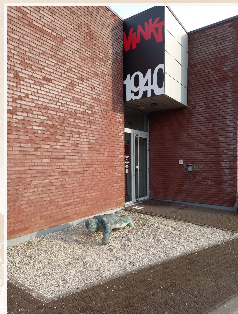
De reflectieruimte 'Vinkt mei 1940' herinnert aan de tragische gebeurtenissen in Vinkt en Meigem bij het begin van de Tweede Wereldoorlog: de meidagen van 1940.