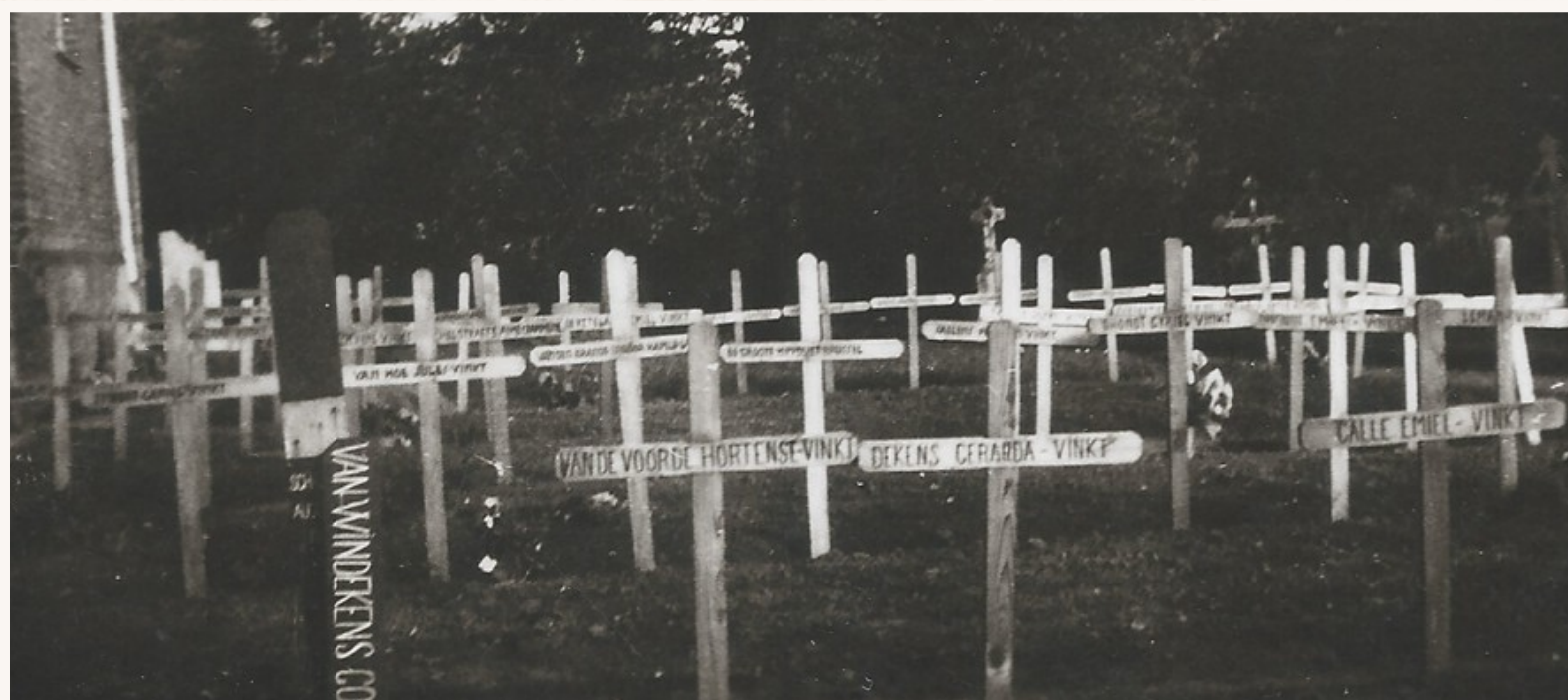
Eerste graven van burgerlijke slachtoffers naast de kerk te Vinkt.

Onbekende man, ongeveer 55 jaar, op 28 mei 1940 om 8 u. aangetroffen op de Heerdweg. Deze persoon werd nooit geïdentificeerd.